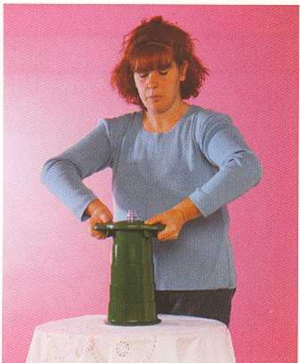
Pressare le bottiglie meno dure