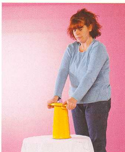
Pressare le bottiglie più dure

UN PICCOLO IMPEGNO PER UN AMBIENTE PIU' PULITO